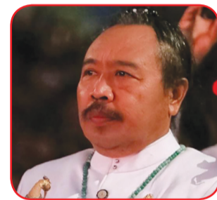
Ratu Shri Bhagawan Putra Natha Nawa Wangsa Pelayun.