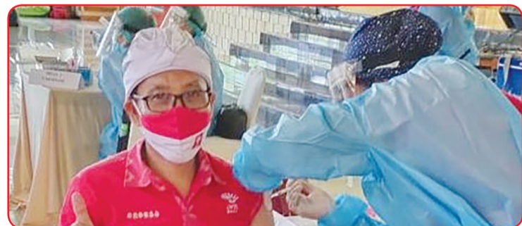
Peserta saat divaksin petugas.