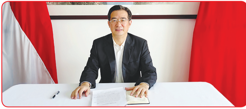
Konjen Zhu Xinglong.

"25 Februari lalu, Tiongkok mengumumkan kepada dunia bahwa sebanyak 98,99 juta warga miskin pedesaan yang hidup dibawah standar saat ini telah terangkat dari kemiskinan. Begitu pula halnya dengan 832 kabupaten miskin. Juga sebanyak 128.000 desa miskin terdaftar juga telah terangkat kehidupannya. Sekaligus menyelesaikan tugas berat mem-