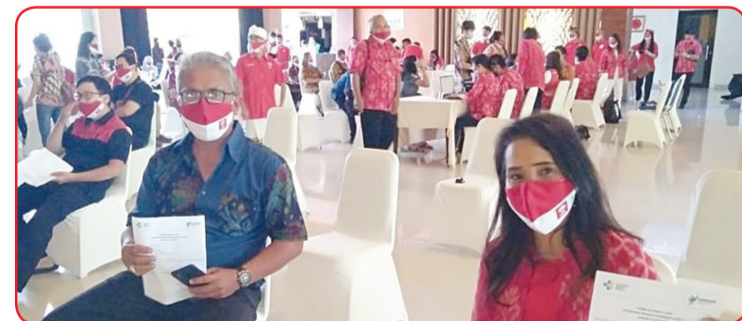
Peserta menerima sertipikat vaksinasi.