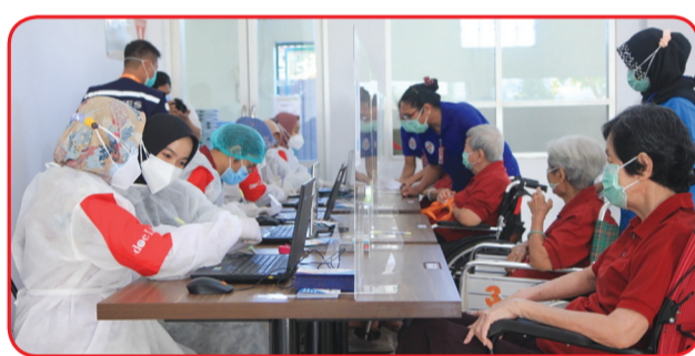
Para lansia menunggu giliran vaksinasi.