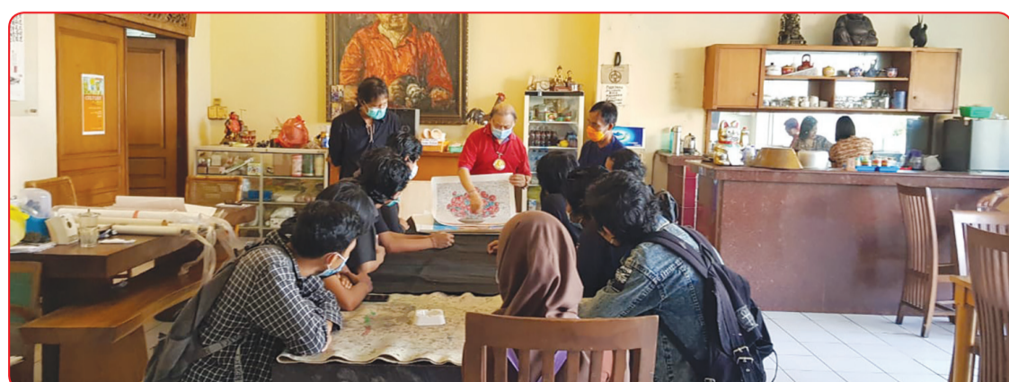
Komunitas Kertas Padi memberikan penjelasan terkait tips dan poin terkait melukis menggunakan kertas padi.