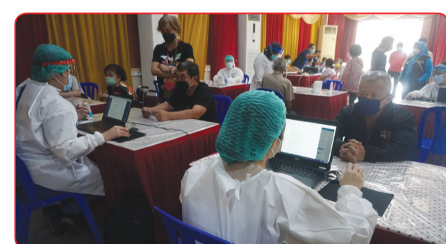
Suasana pendaftaran dan pemeriksaan peserta vaksinasi.

usia, yang memiliki tingkat kerentanan yang tinggi jika terpapar COVID-19.