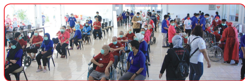
Suasana di Panti Wredha Salam Sejahtera.