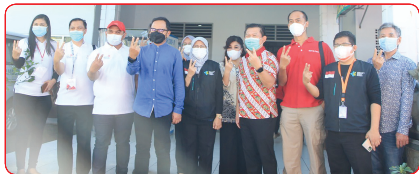
SAMBUT HANGAT: Pimpinan Panti Wredha Salam Sejahtera menyambut hangat Wali Kota Bogor Bima Arya Sugiarto.