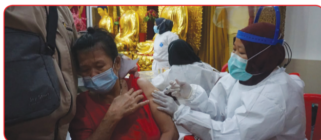
Petugas sedang memberikan vaksin kepada para lansia.

Menurutnya, vaksinasi merupakan salah satu langkah kunci dalam penanganan pandemi Covid-19 maka segenap warga bangsa harus peduli dan bekerjasama dalam mengatasi pandemi ini,