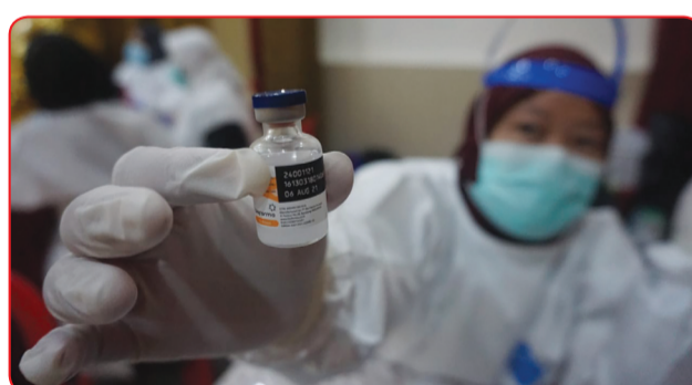
Salah seorang petugas medis memperlihatkan vaksin yang diberikan kepada warga lansia.

Hingga saat ini Pemprov DKI Jakarta telah menerima 1,6 juta vaksin Covid-19 dari pemerintah pusat. Jumlah tersebut, akan terus bertambah hingga target 3 juta vaksin bisa tercapai dan selesai pada waktunya yakni Juni 2021 mendatang. • kris